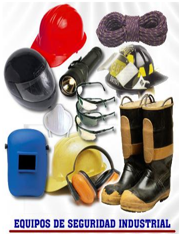
EQUIPOS DE SEGURIDAD INDUSTRIAL